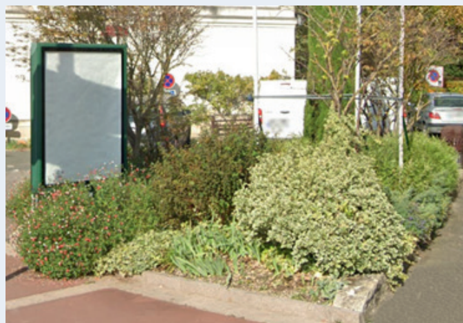
Espace (plus) vert sans publicité, à Loches.

Ce qui n'empêche pas Paysages de France de revendiquer également leur disparition dans les communes de plus de 10 000 habitants. Au regard des enjeux environnementaux actuels, ces publicités pour des produits affectant autant la santé que l'environnement (alcool, malbouffe, SUV, produits de luxe...), installées sur les trottoirs et places publiques, doivent être éradiquées.