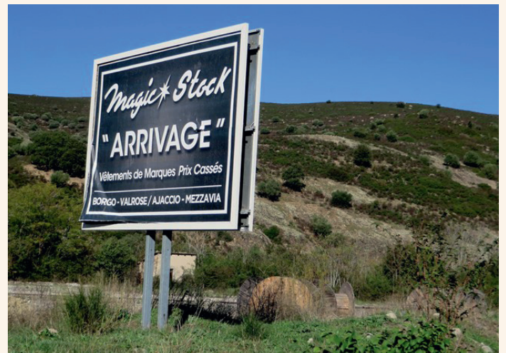
Publicité hors agglomération, commune d'Omessa, le long de la RT20.