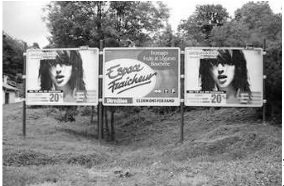
L'afficheur Clear Channel exploitait de nombreux panneaux publicitaires, tous illégaux, dans le PNR Livradois-Forez. Ici, Thiers en 2004. Ces panneaux ne seront démontés qu'en 2006, grâce à la mairie.

La première intervention de l'association remontait au mois d'août 2004. Le panneau en question avait été installé pour réclamer la poursuite des travaux de l'A51, une autoroute très contestée par les associations de protection de l'environnement. Le préfet ne devait jamais répondre et ce n'est que quinze mois après le dépôt d'une requête que le panneau allait être enfin démonté, en présence du président de la CCI, lequel aurait expliqué à la presse que le panneau « déplaçait au préfet » ( sic ). Selon Le Dauphiné Libéré , le président de la CCI aurait même ajouté qu'il n'excluait pas si nécessaire de le remettre en place ! ■