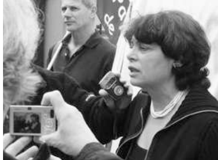
Michèle Rivasi, fondatrice de la CRIIRAD, présidente du CRIIREM et adjointe au maire de Valence, lors du rassemblement du 31 mai 2008 à Saint-Christophe-sur-Guiers.

Mais attention : renseignez-vous avant pour ne pas tomber sur un os car cela peut vous coûter très cher. Comme à La Ruchère, un hameau situé au cœur du PNR de Chartreuse, dans la commune de Saint-