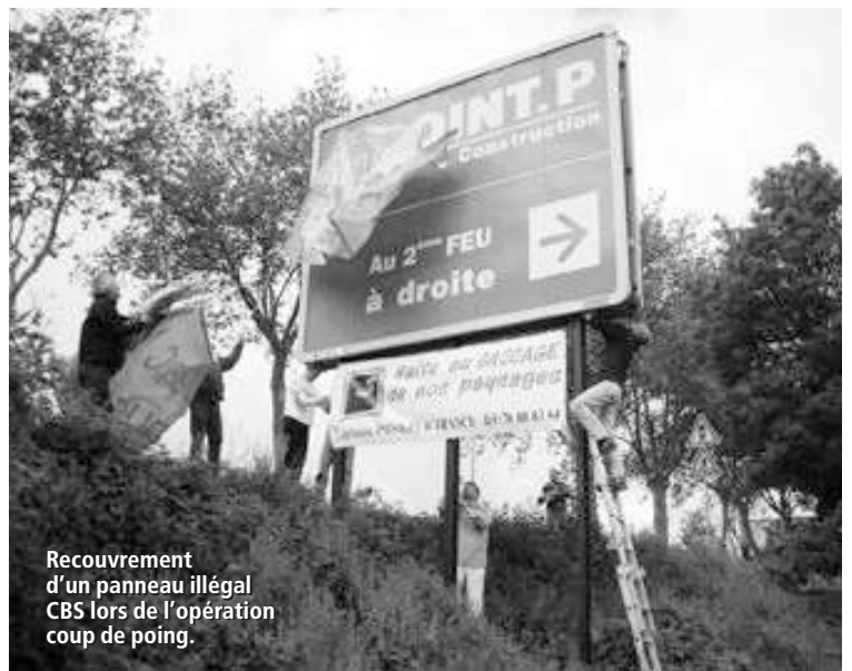
Recouvrement d'un panneau illégal CBS lors de l'opération coup de poing.

Le 18 mai 2008, Paysages de France organisait une opération coup de poing à Mazamet. Au cours de celle-ci, une dizaine de panneaux publicitaires étaient recouverts de bâches comportant les inscriptions « Panneau illégal » ou « Parc naturel régional, pub interdite ». Objectif principal : faire éclater au grand jour le scandale. En effet, jusqu'alors, ni les médias, ni la population n'avaient été informés. C'est