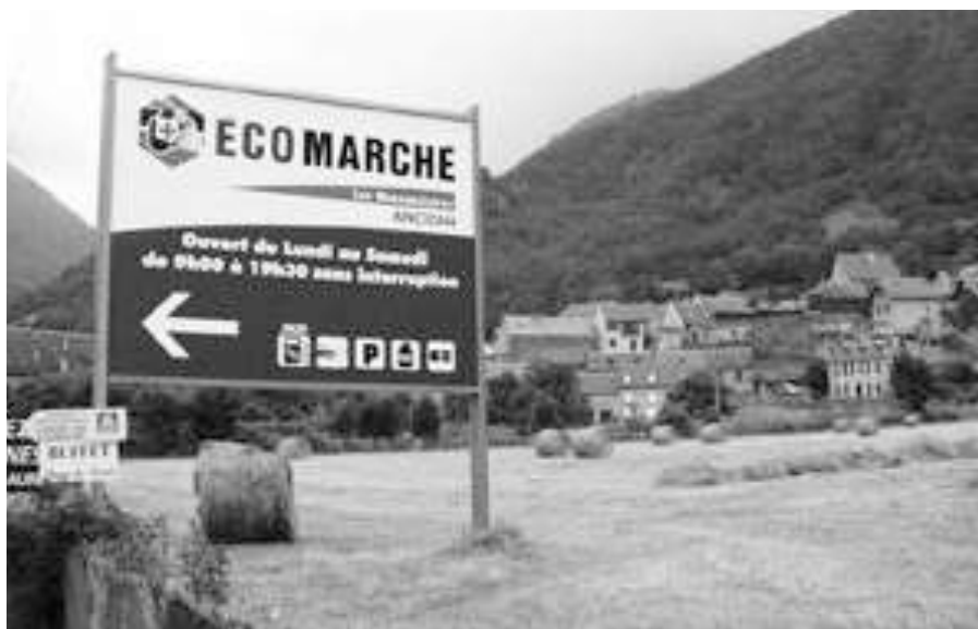
Panneau illégal à Ancizan (parc national des Pyrénées), démonté sur injonction du préfet des Hautes-Pyrénées après intervention de Paysages de France. Des milliers de publicités et d'enseignes de la grande distribution sont installées en violation du Code de l'environnement.