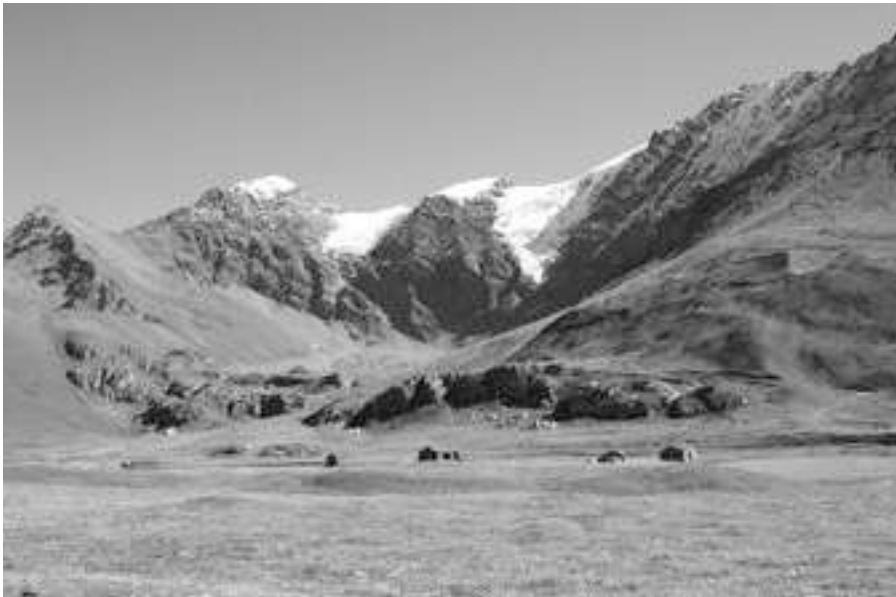
Vivre en Tarentaise