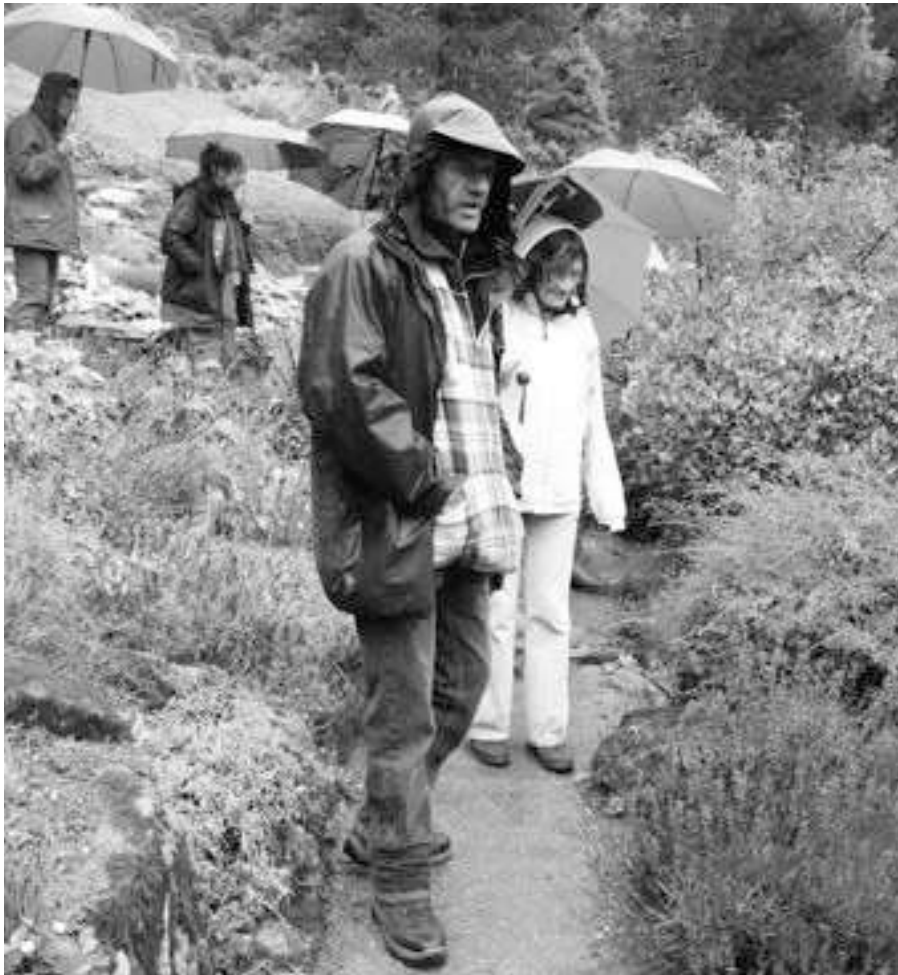
Paysages de France

Sur les traces de la clématite de Chine et de la frêle onosma.