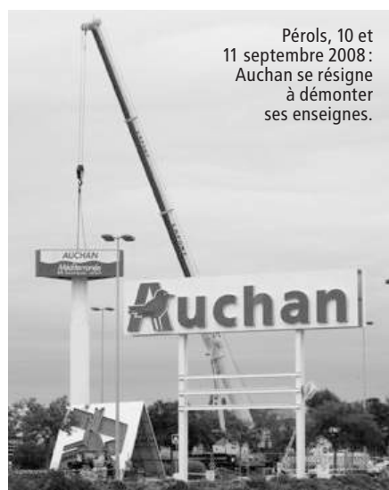
Pérols, 10 et 11 septembre 2008 : Auchan se résigne à démonter ses enseignes.

Pour autant, cela ne signifie pas que tout soit devenu facile. Car le sport favori de certains acteurs de la grande distribution semble