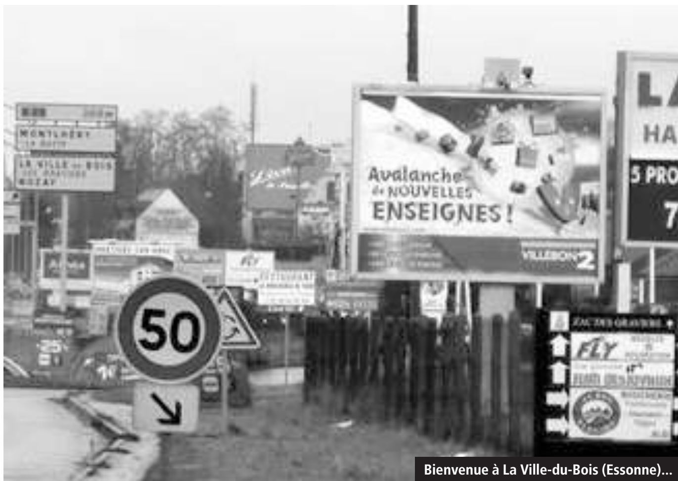
Bienvenue à La Ville-du-Bois (Essonne)...