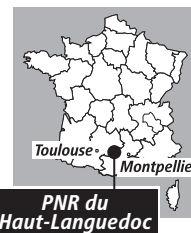
PNR du Haut-Languedoc

Pourtant, aux termes de l'article L. 333-1 du Code de l'environnement, les parcs naturels régionaux « constituent un cadre privilégié des actions menées par les collectivités en faveur de la préservation des paysages ». Le guide d'accueil du PNR du Haut-Languedoc, destiné aux touristes, rappelle que l'une des principales missions des parcs naturels régionaux est de « protéger et gérer la patrimoine naturel, bâti et paysager ». Comment, dans ces conditions, le label « parc » peut-il avoir le moindre sens si une loi destinée à protéger le paysage y est violée au point que la situation est parfois bien pire que dans certaines communes ne bénéficiant d'aucune protection particulière ? ●●●