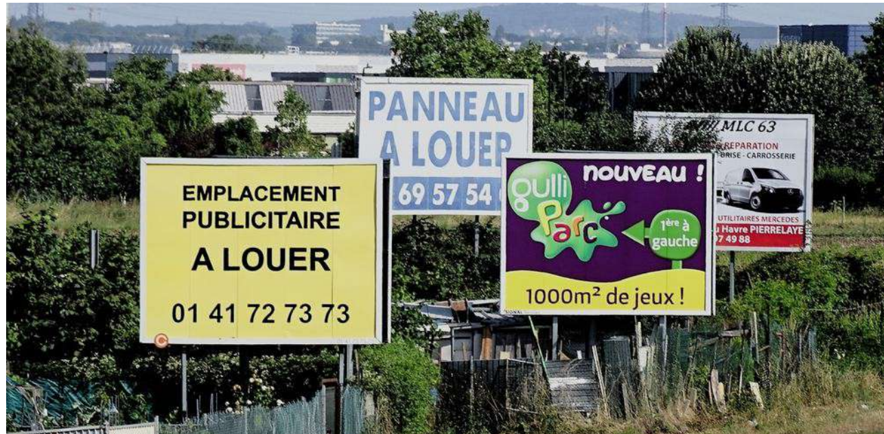
La ville de Conflans-Sainte-Honorine dans les Yvelines remporte le prix de la catégorie « Pépinières de pubs ».

L'association Paysages de France a décerné son palmarès de la « France moche », récompensant des lieux pollués par des panneaux publicitaires