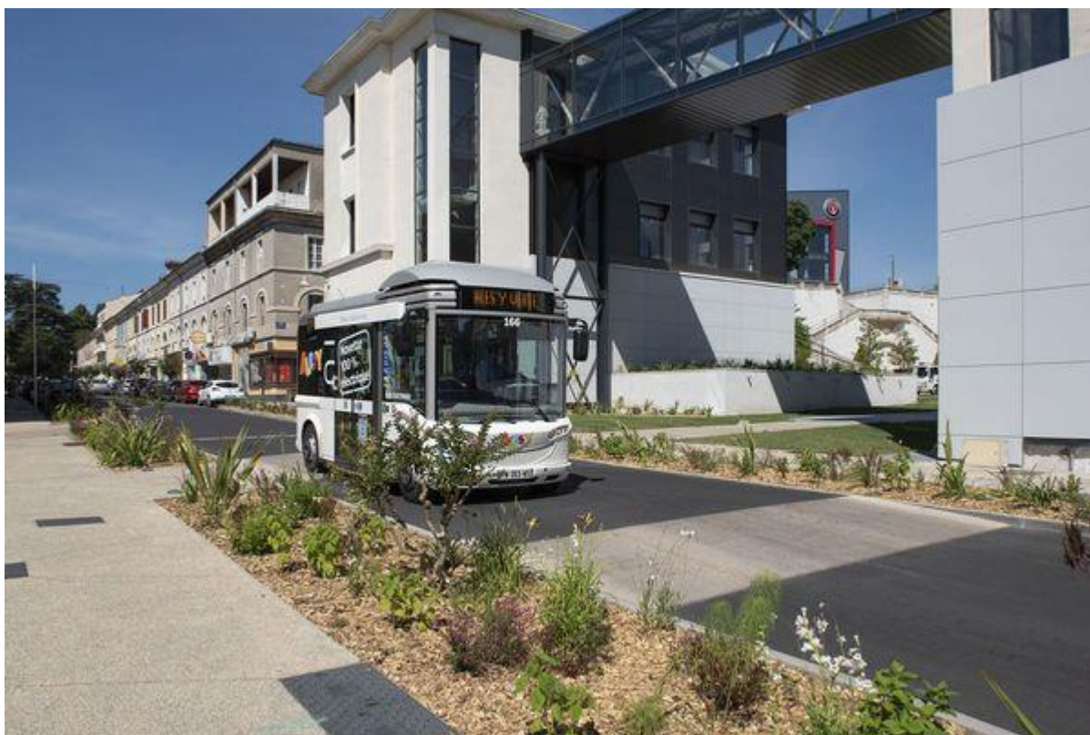
Alès (Gard) - la capitale des Cévennes est labellisée ville "fleur d'Or" - archives.

récompense suprême des villes et villages fleuris de France, la fleur d'Or, pour l'obtention 5 fois consécutives du label "4 fleurs".