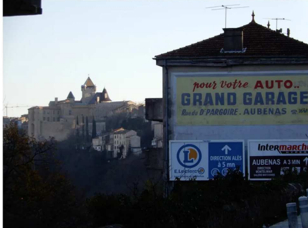
Les panneaux publicitaires ciblés par l'association à Aubenas. - Pdf

Chaque maire a été "félicité" pour l'obtention de son prix, " en lui signalant toutefois qu'il avait les moyens, au travers du règlement local de publicité, de mettre fin à cette anarchie publicitaire impactant fortement les paysages quotidiens ", précise l'association.