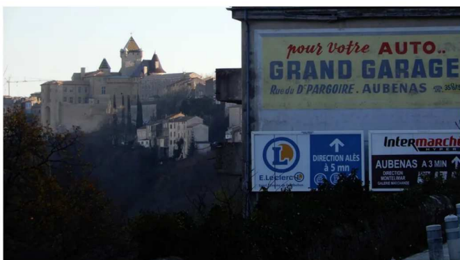
Excédée par l'abondance de panneaux publicitaires, l'association Paysages de France a décidé d'attribuer ses premiers "prix de la France moche". - Pdf

Excédée par l'abondance de panneaux publicitaires, l'association Paysages de France a décidé d'attribuer ses premiers "prix de la France moche". La ville d'Aubenas en Ardèche figure parmi les lauréats.