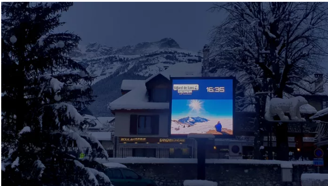
Le panneau municipal de Villard-de-Lans réfléchit à la tombée de la nuit. Paysages de France

Enfin, le prix de la «mise en lumière» du paysage est décerné à la station alpine de Villard-de-Lans «pour cet indispensable panneau numérique qui nous informe [...] qu'il est 16h35 et qui... nous montre le paysage qu'on pourrait voir s'il n'était pas là !».