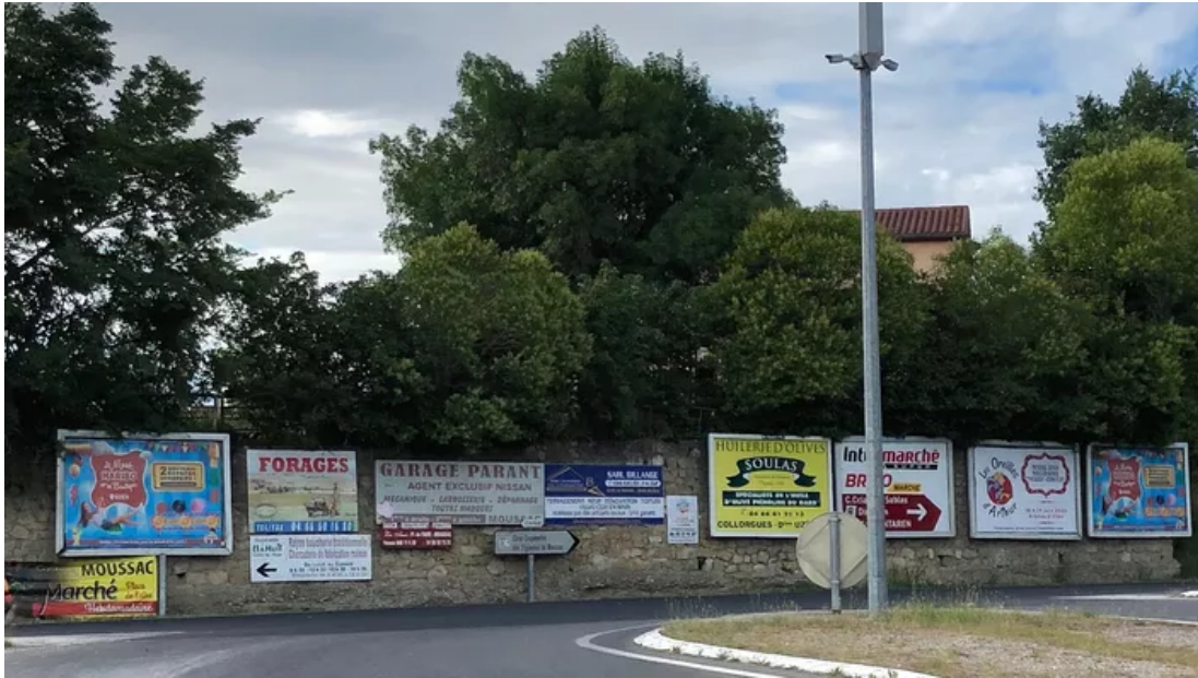
Les panneaux publicitaires se succèdent les uns après les autres à Moussac, dans le Gard. Paysages de France

Moussac, dans le Gard. Pour Paysages de France, c'est «une avenue qui porte bien son nom : la lecture de tous ces panneaux permet aux automobilistes de ne pas s'endormir au volant et d'avoir tout "loisir" de choisir une activité. Bien vu !»