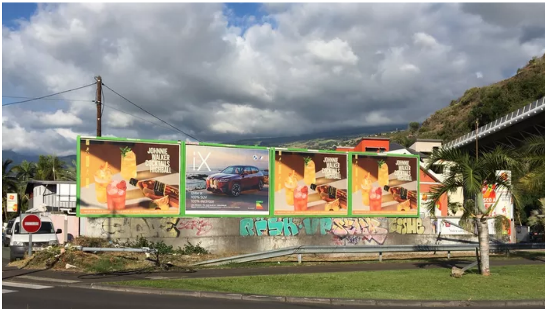
«Trois doses de whisky, une dose de SUV», se moque l'association. Paysages de France

Enfin, le prix de la «mise en lumière» du paysage est décerné à la station alpine de Villard-de-Lans «pour cet indispensable panneau numérique qui nous informe [...] qu'il est 16h35 et qui... nous montre le paysage qu'on pourrait voir s'il n'était pas là !».