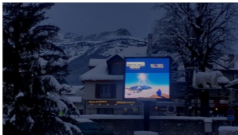
Villard-de-Lans, en Isère

"Cet indispensable panneau numérique [...] qui nous montre le paysage qu'on pourrait voir s'il n'était pas là", a permis à la ville de Villard-de-Lans, en Isère , de décrocher le prix de la "mise en lumière du paysage".