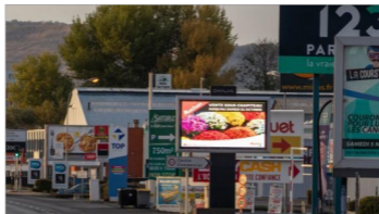
La zone commerciale d'Aubière dans le Puy-de-Dôme

Avec ses panneaux publicitaires en pagaille, la zone commerciale d'Aubière, dans le Puy-de-Dôme , a reçu le prix de la triste banalité. L'association Paysages de France a néanmoins reconnu qu'elle ressemble à "la plupart des zones commerciales de France".