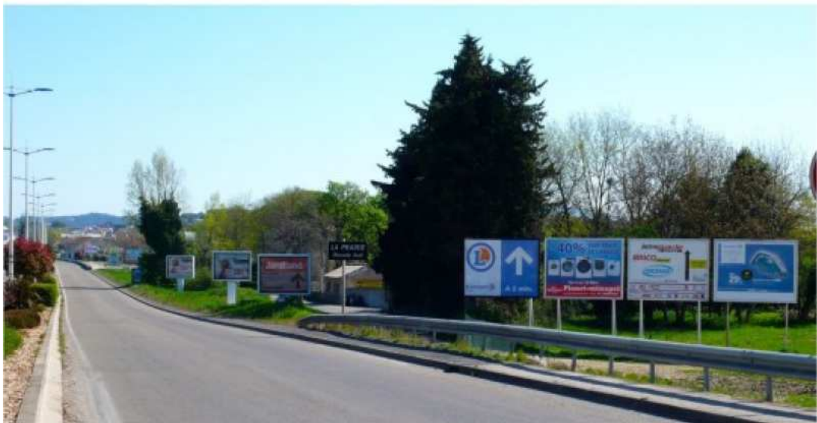
La commune d'Alès a remporté le prix du fleurissement publicitaire.

La commune Saint-Germain-du-Puy, dans le Cher, a gagné le prix spécial pour l'ensemble de son "œuvre" . L'association a récompensé notamment les efforts de la ville pour rendre invisibles les panneaux de signalisation. "L'accumulation de panneaux publicitaires, enseignes, poteaux et autres lampadaires les noie parfaitement dans le 'paysage'", peut-on lire dans le communiqué.