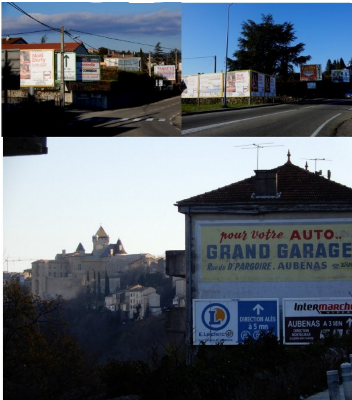
Aubenas a été récompensé par le prix de la « mise en valeur » du patrimoine.

L'association œuvre depuis des années pour lutter contre les atteintes au paysage et notamment contre les formes de pollution visuelle . Celle-ci agit au niveau national et local en apportant son expertise à la réflexion dans le cadre de l'élaboration des réglementations locales de l'affichage publicitaire.